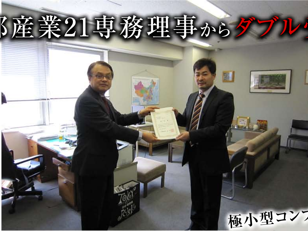
極小型コンプレッサー